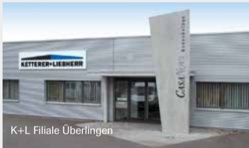
K+L Filiale Überlingen