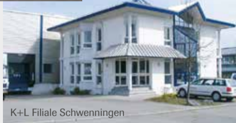
K+L Filiale Schwenningen

Aus den zwei K+L Standorten in Schwenningen und Überlingen wurde zu Jahresbeginn die neue Verkaufsregion Schwarzwald-Bodensee geschaffen. Diese beiden Standorte treten als eine Einheit am Markt auf mit dem Ziel, durch bessere Potenzialausschöpfung und flächendeckende Gebietsbearbeitung mehr Effizienz zum Nutzen der Kunden zu erreichen.